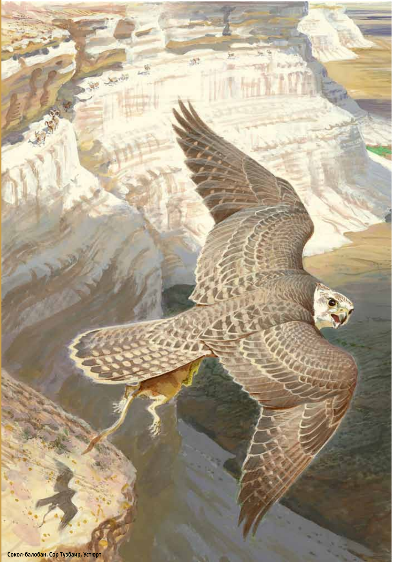
Сокол-балобан. Сор Тузбаир. Устюрт