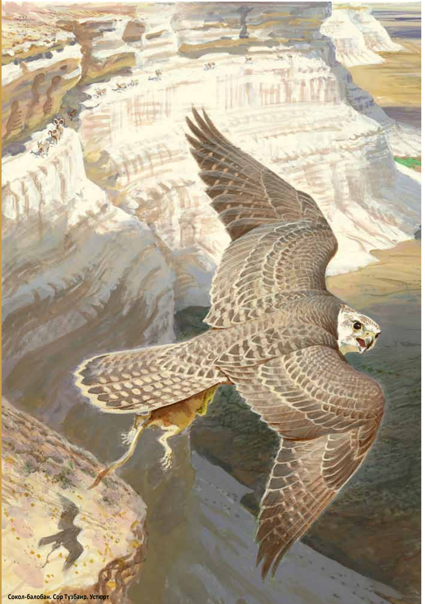
Сокол-балобан. Сор Тузбаир. Устюрт